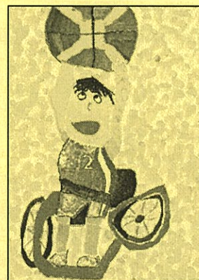
令和4年度小学生部門最優秀賞作品